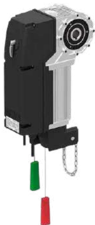
Привод Targo с внешним блоком управления