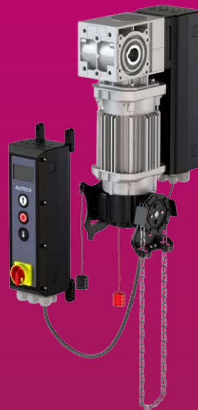
Высокоскоростной привод HS140-S