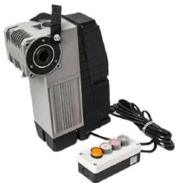
Привод Targo со встроенным блоком управления